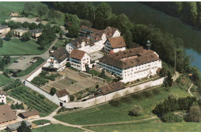
Ora et labora – Bete und arbeite (Hl. Benedikt)

Als im Jahre 1973 die konfessionellen Ausnahmeregelungen in der Bundesverfassung in einer Volksabstimmung beseitigt wurden, erhielt das Kloster seine volle Existenzberechtigung zurück und durfte offiziell wieder Novizinnen aufnehmen.