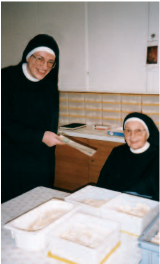
Bei der Administration