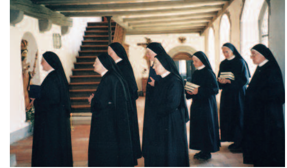
Ora et labora – Bete und arbeite (Hl. Benedikt)